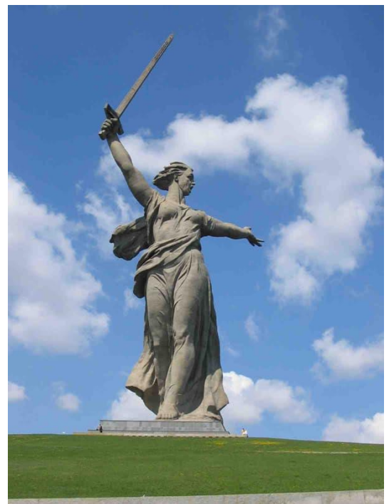
Мамаев курган. Монумент "Родина-мать зовет"

Город-герой Волгоград... В 1942 году у стен Сталинграда решалась судьба всего цивилизованного мира. В междуречье Волги и Дона развернулось величайшее в истории войн сражение. 12 июля 1942 г. страшная бомбардировка обрушилась на город, он превратился буквально в огненное зарево, образовался Сталинградский фронт, а день 17 июля вошел в историю как начало Сталинградской битвы. Однако фашисты не смогли сломить оборону. 19 ноября немцы оказались в окружении советских войск. «...Двести дней и ночей бушевала великая битва...». 1-го мая 1945 года приказом Верховного Главнокомандующего городу Сталинграду присвоено почетное звание города-героя. Весь мир знает Волгоград как героический, мужественный, стоический город, сумевший отстоять свои рубежи ценой тысяч своих сыновей и переломить силы врага, укрепив Россию на пути в победу и повернув тем самым вспять ход всей мировой истории.