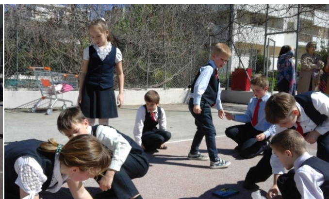
Команда «Подснежники» начала рисовать.

24 марта в нашей школе прошёл конкурс «Рисунки на асфальте». В нём приняли участие ученики начальной школы. Учащимся было дано задание - нарисовать пейзаж на тему весны и рассказано про критерии оценивания работ, а именно: сюжет, композиция, плановость, соответствие теме задания и сплочённая работа в группе. Всего было 47 участников, а группы разновозрастные. Капитану каждой команды мы раздали белые и цветные мелки. На выполнение рисунка было дано 40 минут – один урок. Каждая команда рисовала очень большой рисунок, который называется гигантюра.