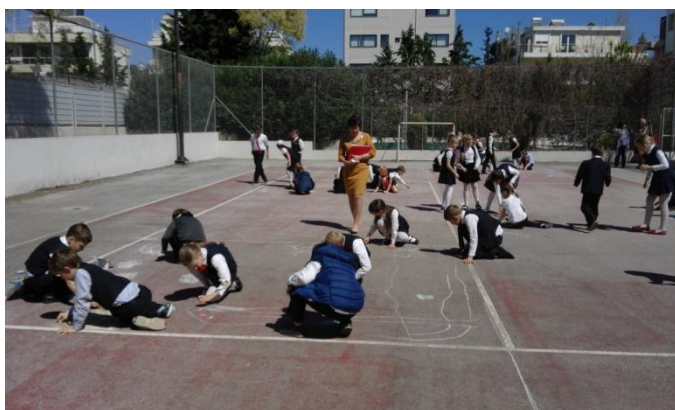
Начался конкурс, участники за работой.