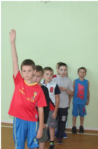
Фото-отчет «Веселые старты в каникулы»