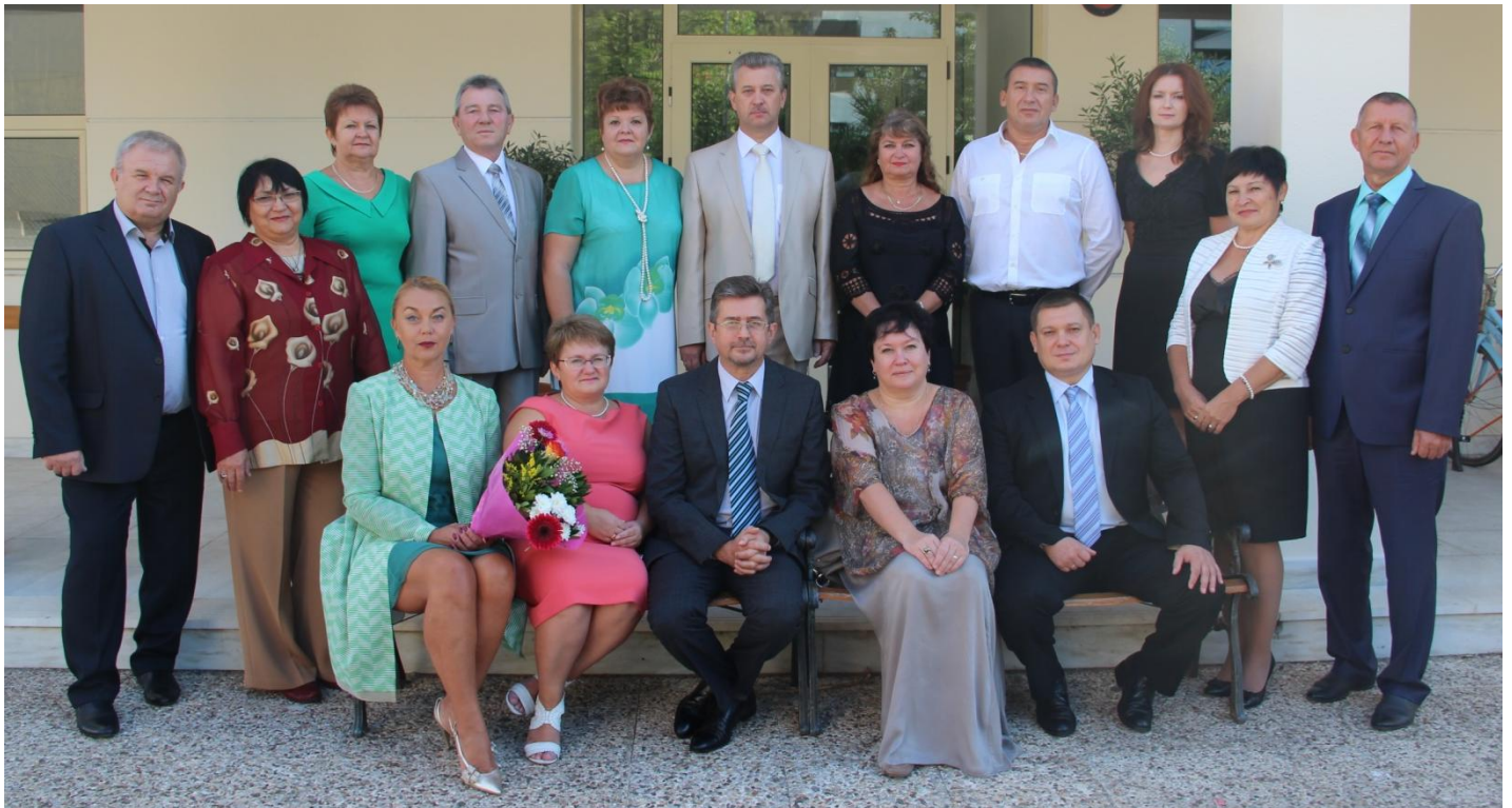
Педагогический коллектив школы (фото от 2 октября 2015 года)

Мы часто забываем, что учителю порой крайне необходима наша личная поддержка и внимание... Нам же остается со своей стороны поздравить всех любимых учителей школы с Днем учителя, с профессиональным праздником и пожелать от всего сердца всего наилучшего, успехов в интересном и ответственном труде!