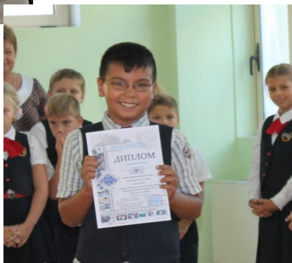
Фото. Наши Призеры