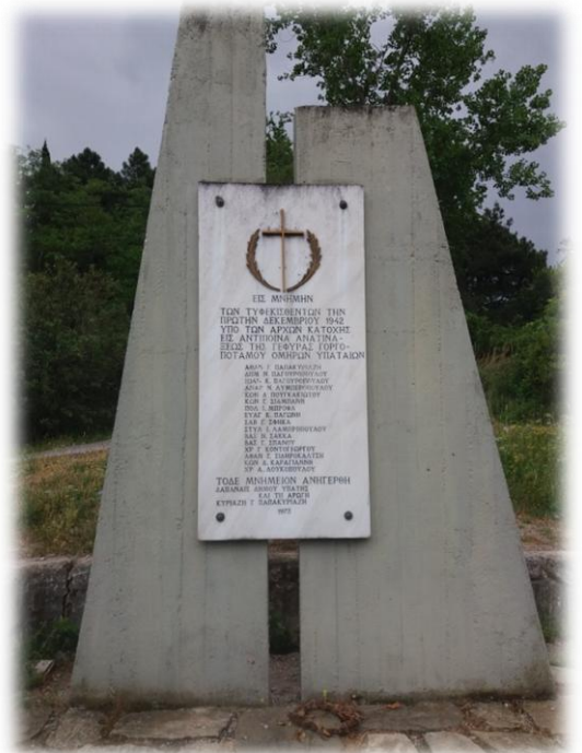
Памятник погибшим у моста Горгопотамос