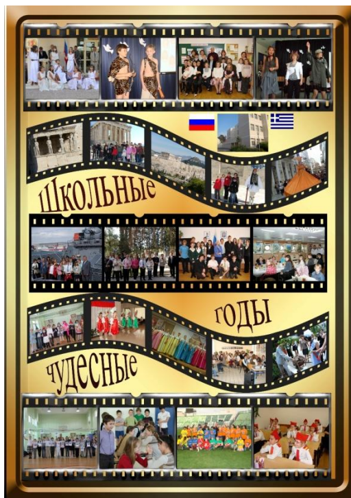
«Школьные годы чудесные» Е.Шигиновой