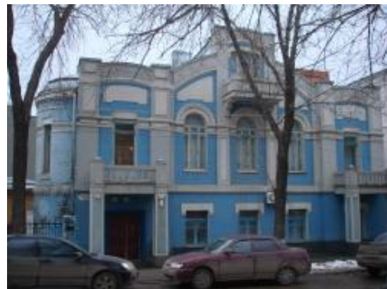
Посольство Греции. Ул. Степана Разина, 126.

В годы войны в Самаре располагались зарубежные дипломаты и послы. Всего в Самаре были 24 посольства.