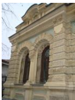
Посольство Чехословакии. Ул. Фрунзе, 113.