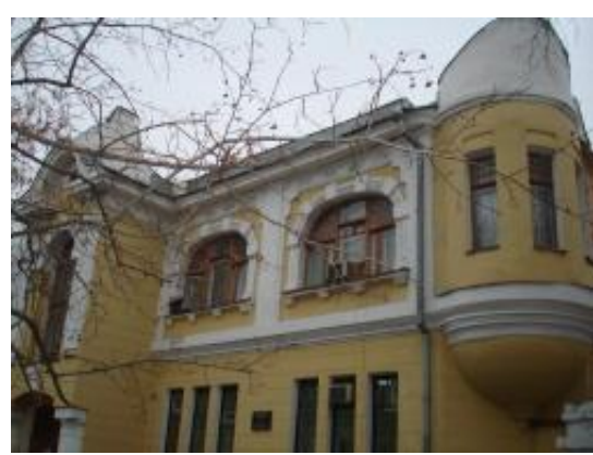
Посольство Польши. Особняк Эрна. Ул. Чапаевская, 165.

Являясь ведущим промышленным центром, Куйбышев играл важную роль в вооружении СССР. С самых первых месяцев Великой Отечественной войны город снабжал фронт самолетами, огнестрельным оружием и боеприпасами. 5 марта 1942 г. в Самаре была впервые исполнена симфония Шостаковича. Симфонии транслировалось по всему миру.