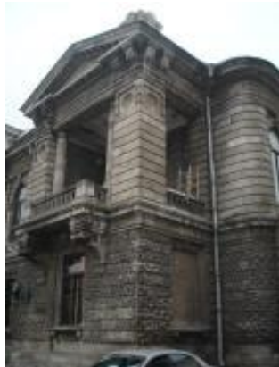
Посольство Великобритании. Особняк Наумова. Ул. Куйбышева, 151.