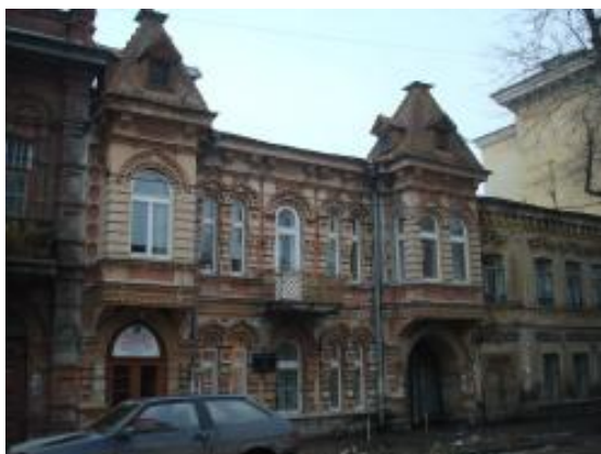
Посольство Норвегии. Особняк купца Васильева. Ул. Молодогвардейская, 119.

В годы войны в Самаре располагались зарубежные дипломаты и послы. Всего в Самаре были 24 посольства.