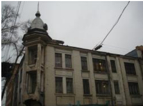
Посольство Болгарии. Ул. Молодогвардейская, 126.

Одним из самых интересных моментов истории нашего города является период ВОВ, когда Самара носила название «Куйбышев» и с октября 1941 года по август 1943 года стала запасной столицей Советского Союза. Эти годы не самого давнего в масштабах истории прошлого, как ни странно, изучены немного. Обычно знания самарцев о том времени исчерпываются общеизвестными фактами о Большом Театре, 7-й симфонии Шостаковича и эвакуированных заводах. Но это, конечно же, не так. Столица не может считаться таковой, если не признана дипломатами других стран. Наличие в нашем городе иностранных посольств и миссий придавало «запасной столице» международный статус.