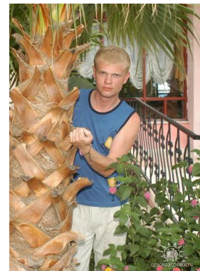
Любимые внук, дочь и сын

– А что повлияло на формирование Вашего мировоззрения?